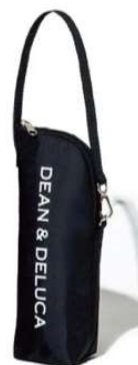
ペットボトルホルダー